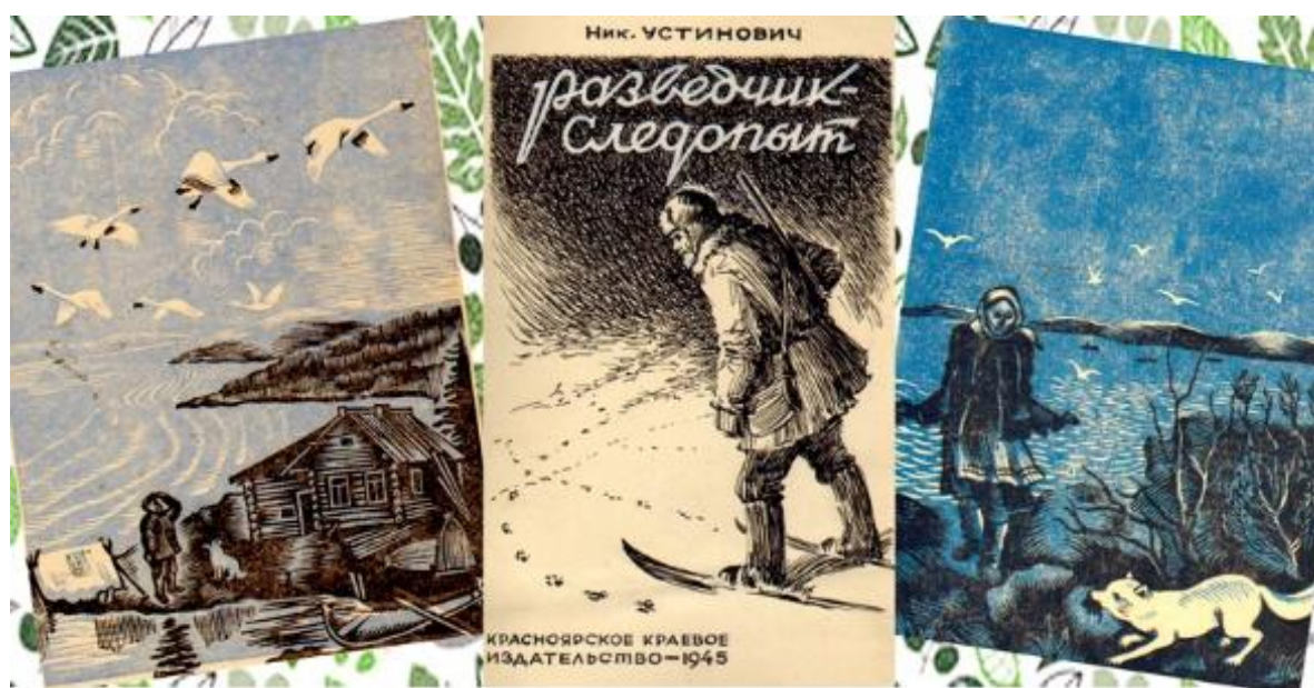
Обложка сборника рассказов Н.С. Устиновича «Разведчик-следопыт» и иллюстрации В.М. Мешкова

Устинович Николай Станиславович родился 18 мая 1912 г. в деревне Горелый Борок Нижнеингашского района Красноярского края. Первый рассказ Николая Устиновича — «Орудие» — увидел свет 20 августа 1930 г. Он был напечатан в московской «Охотничьей газете». Вскоре были опубликованы новеллы и зарисовки «Бердана», «Пурга» и «Тайга зовет» в московском журнале «Охотник» и в новосибирском «Охотник и рыбак Сибири». Автору в то время было только 19 лет.